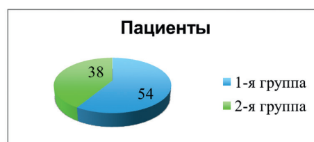
Рис. 1. Распределение пациентов в группах наблюдения.

Всего под наблюдением находилось 92 пациента. Наблюдение за пациентами проводилось с момента поступления в стационар и установления диагноза критической ишемии, связанной с поражением артерий голени. Все больные были разделены на две группы. В 1-й группе (54 пациента) методом лечения являлась транслюминальная баллонная ангиопластика. Во 2-й группе (38 пациентов) методом коррекции кровотока являлся терапевтический ангиогенез препаратом «Неоваскулген» (рис. 1).